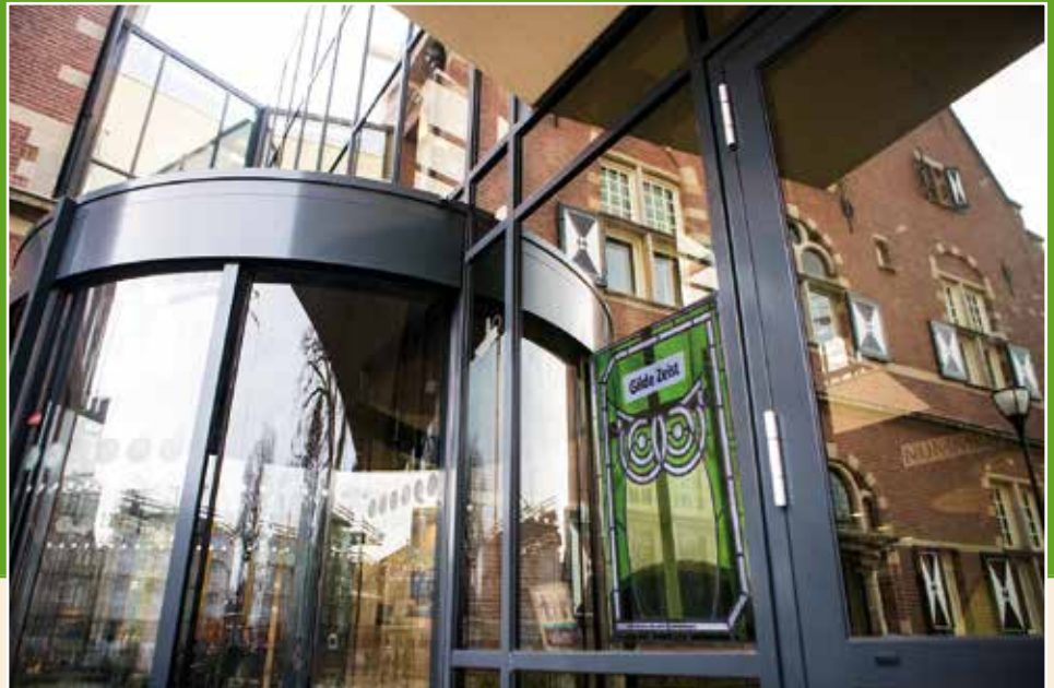
Entree nieuwe gemeentehuis Zeist